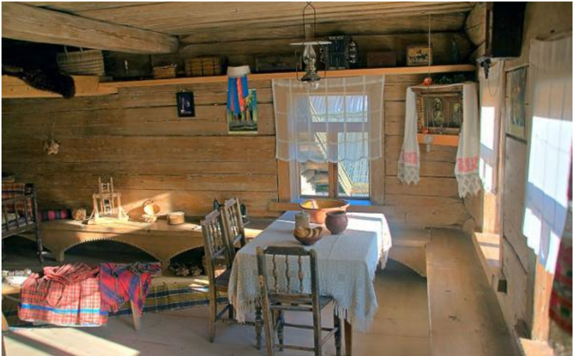
красный угол – главное, почетное место в избе