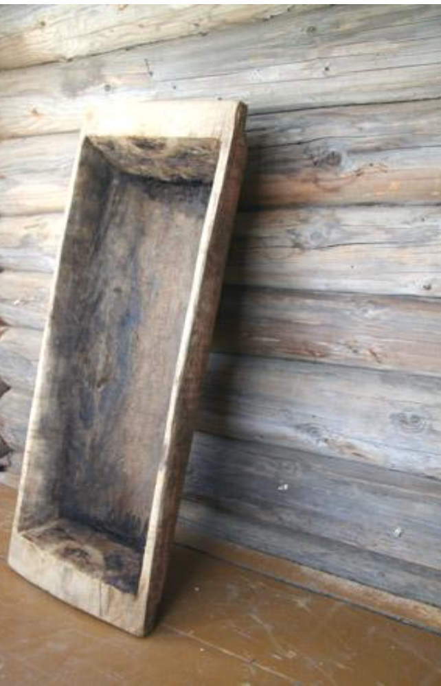
Деревянное корыто для стирки белья