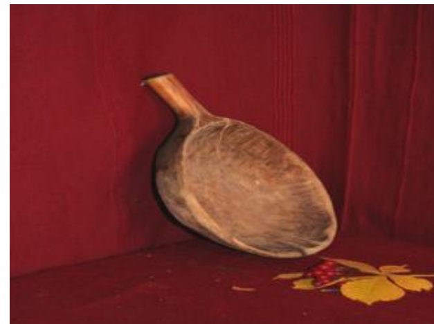
Деревянная миска одноручная