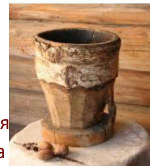
Ступка для измельчения круп и зерна