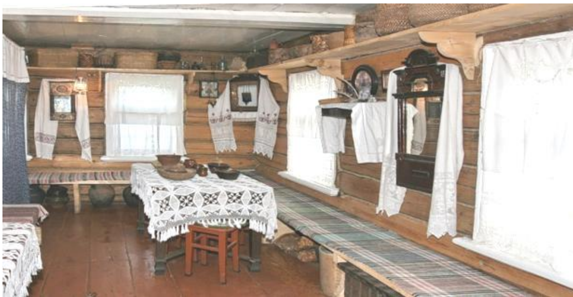
мебель в избе